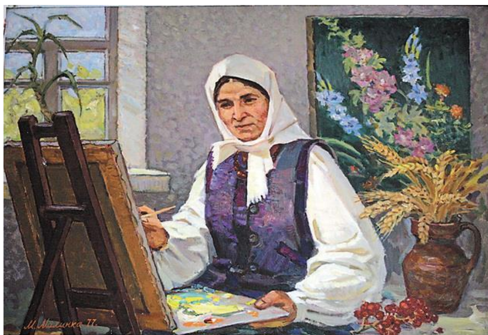
Рис.6 М. Малинка «Натхення»