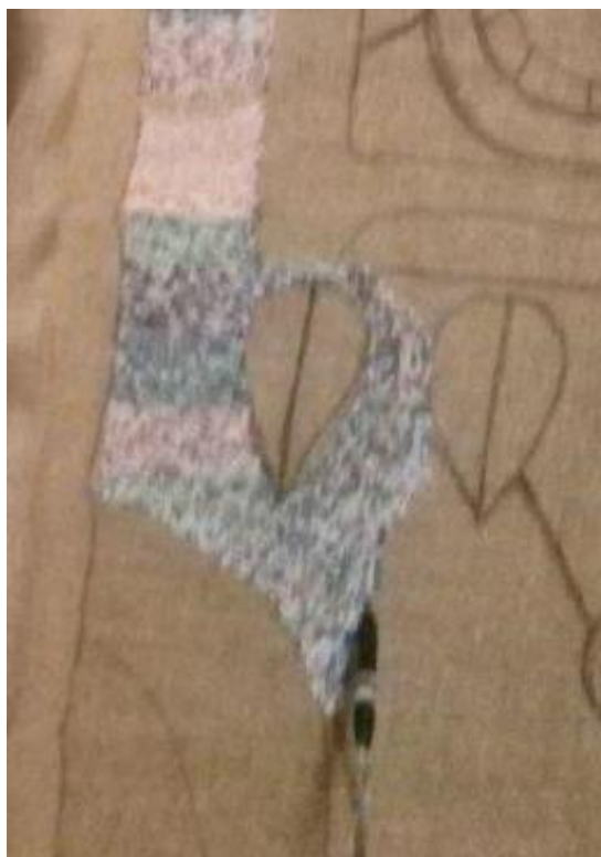
Рис.8 Процес створення дипломної роботи