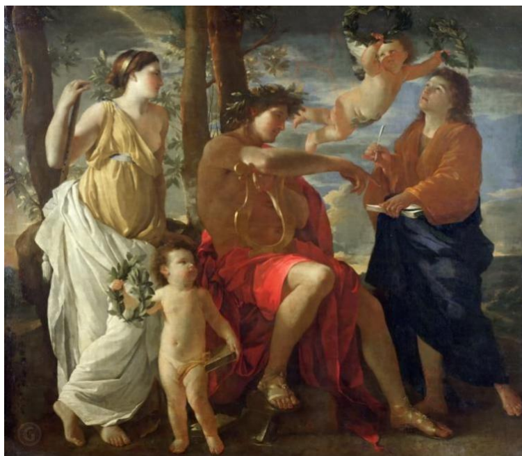
Рис.1 Нікула Пуссен «Натхнення поета»