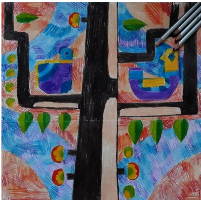
Рис.7 Ескіз дипломної роботи