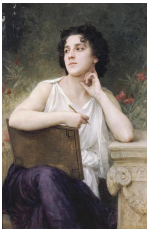
Рис.3 Вільям-Адольф Бурго «Натхнення»