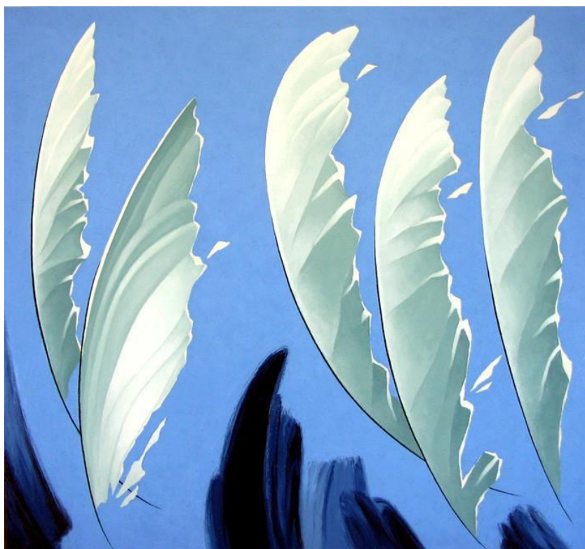
Рис.5 О. Олігеров «Натхення»,