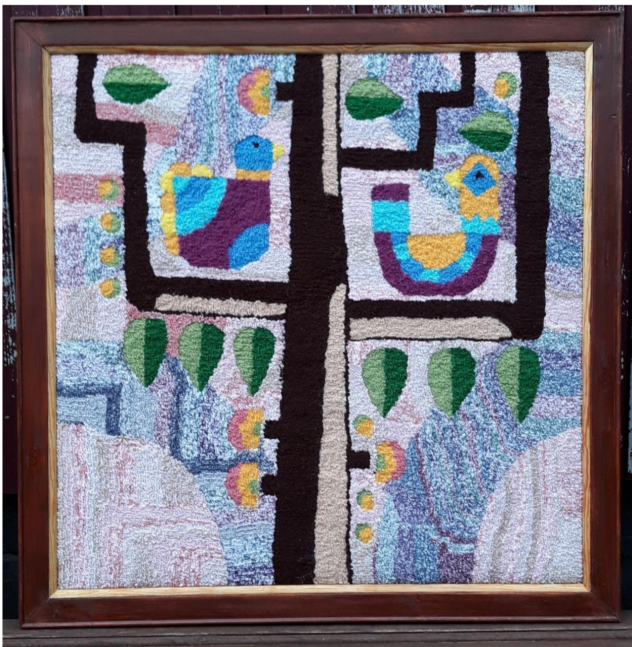
Рис.9 Авторська дипломна робота Панно «Натхнення»