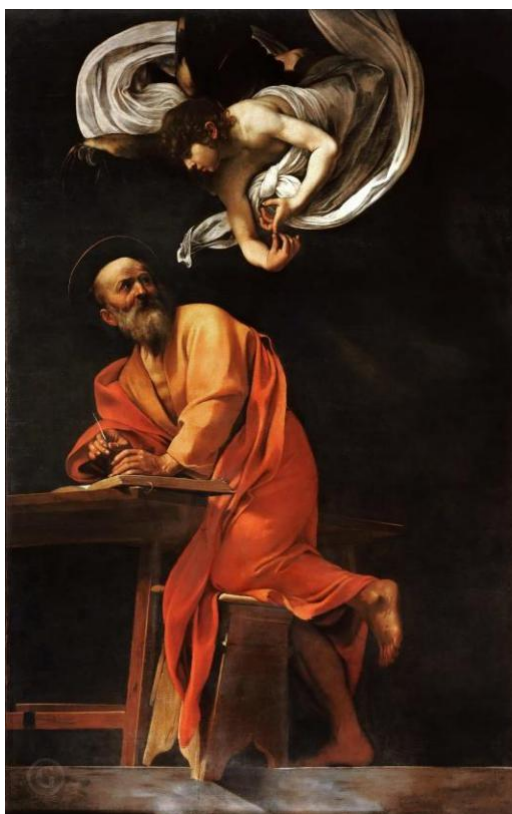
Рис. 2 Мікеланджело Мерізі да Караваджо «Святий Матвій та янгол»