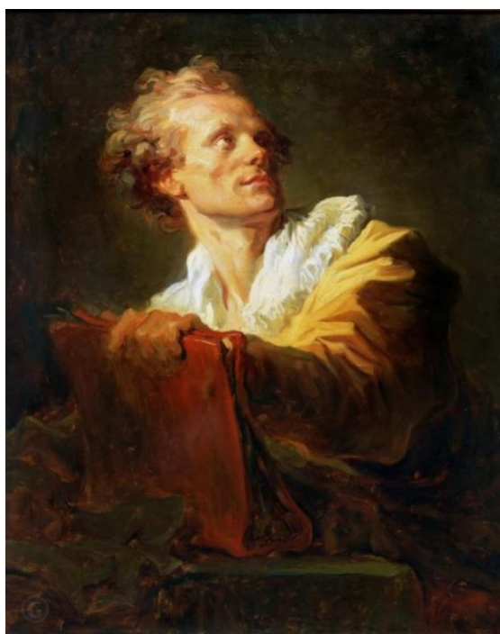
Рис.4 Жан Оноре Фрагонар «Портрет молодого художника (Натхнення)»