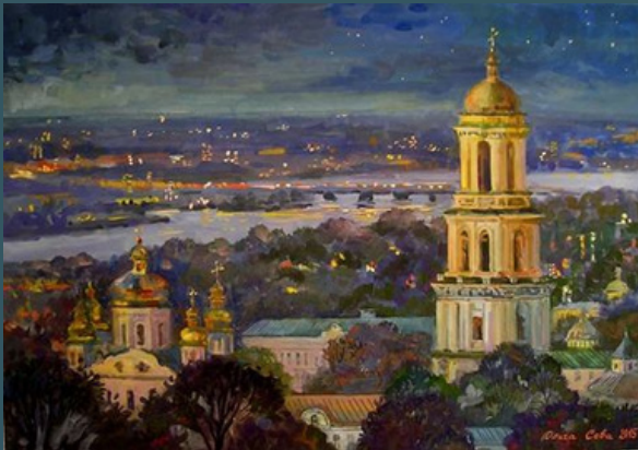
Нічна Лавра. 2015