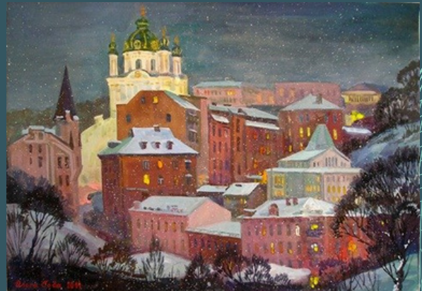
Перший сніг на Андріївському узвозі. 2014