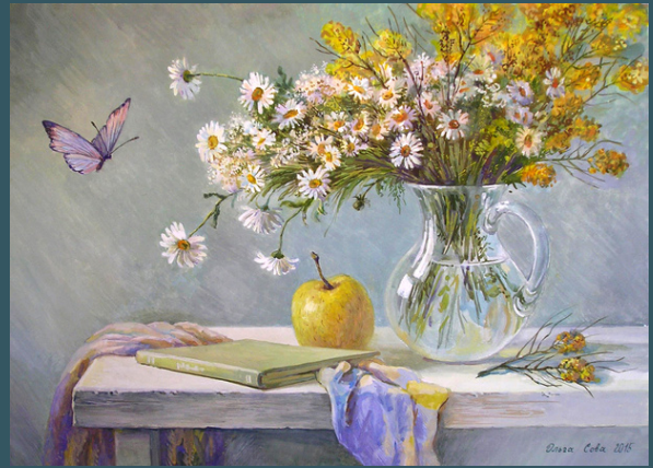
Літній настрій. 2015