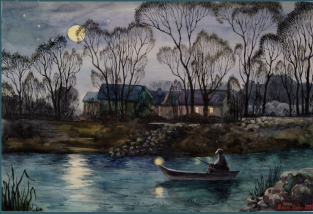
Місячне сяйво. 2020

Творчі роботи перебувають у колекціях Кмитівського музею образотворчого мистецтва ім. Й.Д. Буханчука, Національного музею літератури України та приватник колекціях України, Німеччини, Канади і США